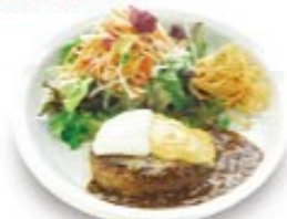
ダブルチーズ ハンバーグ + ¥50 (税込¥55)