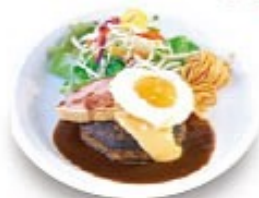
厚切りベーコンの ふる玉チーズハンバーグ + ¥50 (税込¥55)