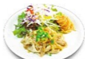
ごはんがすすむ ポーク生姜焼き ソースの選択はできません

&lt;ミニドリアコンボ&gt; ALL プラス200円(税込220円) クリームミニドリアまたは洋風デミニドリアをお選び下さいませ