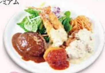
定価 レディースプレート + ¥300 (税込¥330)

スープ、ライス、ハンバーグ100g、 チキン南蛮80g、コロッケ、海老フライ2尾