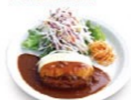
モzzarellaチーズ ハンバーグ + ¥50 (税込¥55)