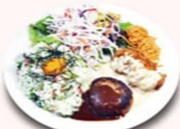
ダブルプレート (おしんこピラフ) + ¥180 (税込¥198)