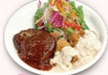
定価 ツインプレート + ¥300 (税込¥330)

スープ、ライス、ハンバーグ100g、 チキン南蛮80g、コロッケ、海老フライ2尾