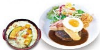
ふる玉チーズハンバーグ & クリームミニドリア

&lt;ミニドリアコンボ&gt; ALL プラス200円(税込220円) クリームミニドリアまたは洋風デミニドリアをお選び下さいませ