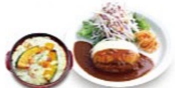
モzzarellaチーズハンバーグ & クリームミニドリア