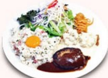
ダブルプレート (梅ピラフ) + ¥180 (税込¥198)