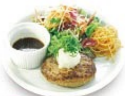
定価 つけて食べる 和風ソースハンバーグ ソースの選択はできません