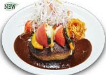
かぼちゃとトマトの チーズハンバーグ

※ライスはパンに変更できます(ガーリックorバター) ※ライス大盛りはプラス¥110