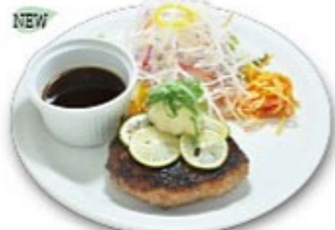
へべすとおろしの 和風ハンバーグ ソースの選択はできません