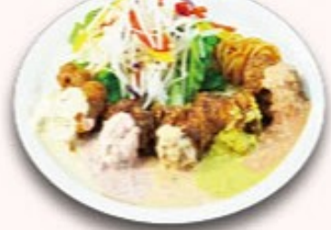
チキン5種南蛮 + ¥200 (税込¥230)