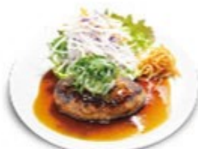
テリヤキ ハンバーグ ソースの選択はできません