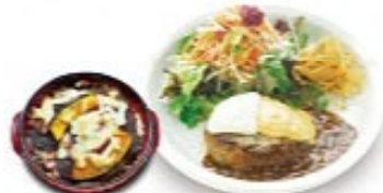
ダブルチーズハンバーグ & 洋風デミニドリア