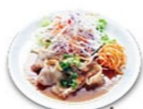
ガーリックの ポーク生姜焼き ソースの選択はできません