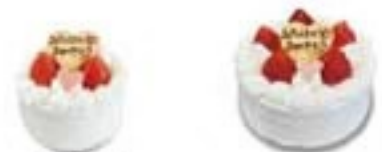
パースデー 生クリームデコレーションケーキ 1half(4号)¥2900税別¥2132 (5号)¥3600税別¥3000