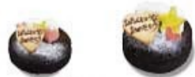
パースデー クラシックショコラ 1half(4号)¥3200税別¥2456 (5号)¥4000税別¥3200