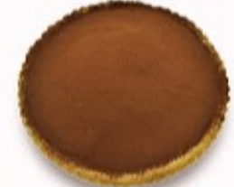
ティラミス タルト 単品350円 (税込385円)