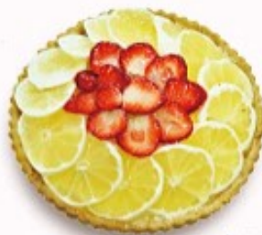
日向夏と苺のタルト 単品350円 (税込385円)