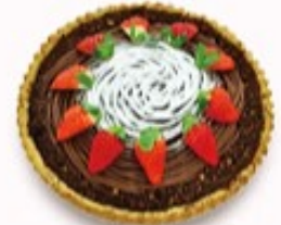
チョコレート モンブランタルト 単品350円 (税込385円)