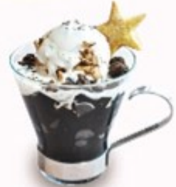
エラティナ ディカフェ セット900円 (税込990円) 単品600円 (税込660円)