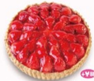
+¥55 苺のタルト 単品400円 (税込440円)