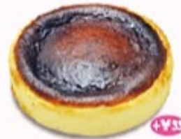
+¥35 バスク チーズケーキ 単品410円 (税込451円)