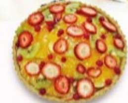
2月の フルーツタルト 単品350円 (税込385円)