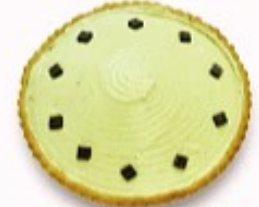
ピスタチオ タルト 単品350円 (税込385円)