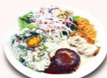
ダブルプレート (おしんこピラフ)