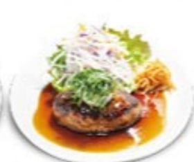
テリヤキハンバーグ