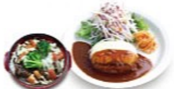
モzzarellaチーズハンバーグ &amp; カレーミニドリア