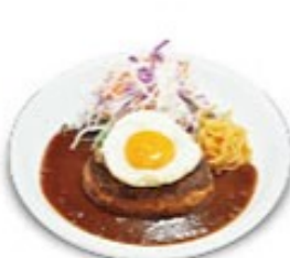
ふる玉ハンバーグ