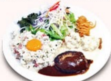
ダブルプレート (梅ピラフ)