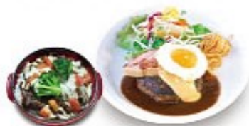
ふる玉チーズハンバーグ &amp; カレーミニドリア

&lt;ミニドリアコンボ&gt; ALL プラス200円(税込220円) カレーミニドリアまたはトマトミニドリアをお選び下さいませ