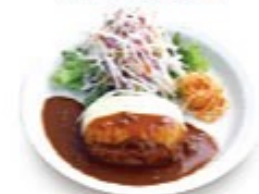
モzzarellaチーズハンバーグ