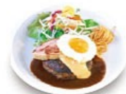
厚切りベーコンのふる玉チーズハンバーグ