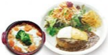
ダブルチーズハンバーグ &amp; トマトミニドリア