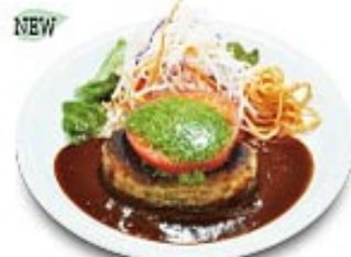
フレッシュトマトとバジルのハンバーグ

※ライスはパンに変更できます(ガーリックorバター) ※ライス大盛りはプラス¥110