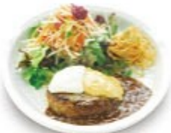
ダブルチーズハンバーグ