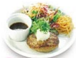
つけて食べる和風ソースハンバーグ