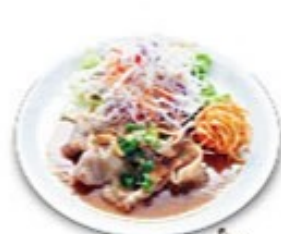
ガーリックのポーク生姜焼き