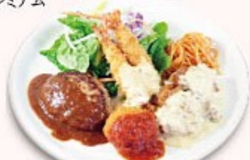
レディースプレート