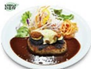
茄子ミートのチーズハンバーグ