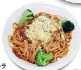
ボロネーゼ たっぷり野菜をじっくり煮込み新鮮な挽き肉を合わせた極かしの味