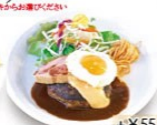
+¥55 厚切りベーコンのぶる玉チーズハンバーグ