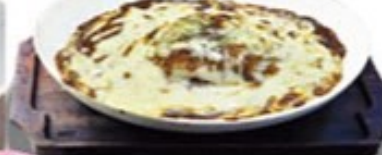
デミグラスとチーズのハンバーグドリヤ