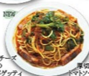
菜の花と厚切りベーコンのトマトソーススパゲッティ 菜の花の優しい苦みとトマトソースは相性抜群!