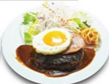
ハムエッグハンバーグ