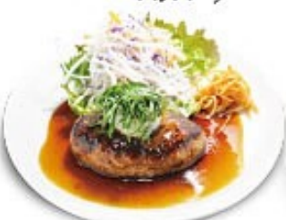
テリヤキハンバーグ ソースの選択はできません