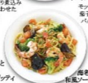
海老と茄子の和風ソーススパゲッティ プリプリ海老と揚げ茄子等野菜もしっかり和風スパ