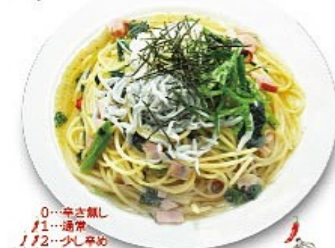
釜揚げしらすのペペロンチーノ 大根おろし添え

セット内容:スープ・ミニサラダ・ケーキ・ドリンク(菜園風スパゲッティにミニサラダは付きません)