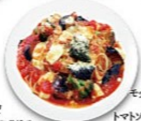
モッツァレラチーズと茄子のトマトソーススパゲッティ モッツァレラチーズ・茄子・ブロッコリー・パルメザンチーズ