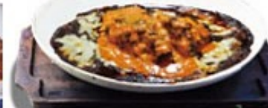
旨辛南蛮カレードリア