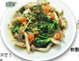
菜の花とあさりの和風ソーススパゲッティ

当店人気上位の商品 たっぷり野菜をにんにく醤油ソースで! 1日分の野菜がしっかりとれる