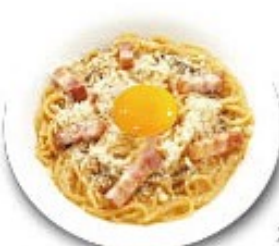
カルボナーラ あっさり食べやすくなりました