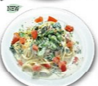
菜の花とベーコンのクリームソーススパゲッティ