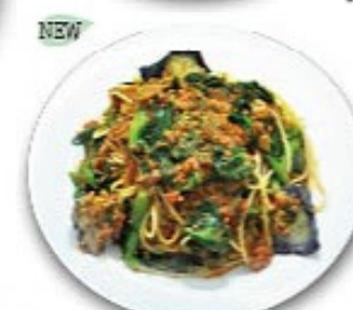
菜の花と茄子のボロネーゼ