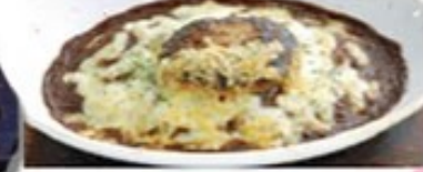
ハンバーグカレードリア