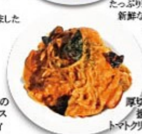
厚切りベーコンと揚げ茄子のトマトクリームスパゲッティ カリカリのベーコンと揚げ茄子の旨味がトマトクリームに絡む