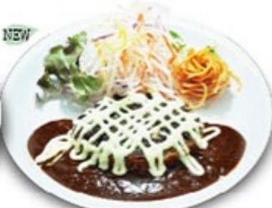
特製わさびマヨネーズソースのハンバーグ ソースをデミグラス、テリヤキからお選びください