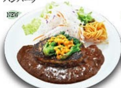
菜の花とチェダーチーズのハンバーグ