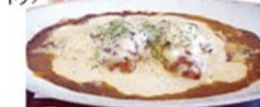
定番 チキン南蛮カレードリア