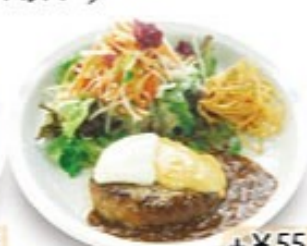
+¥55 ダブルチーズハンバーグ