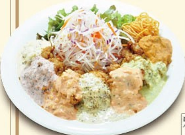
レインボー南蛮 チキン7種南蛮

※ライスはパンに変更できます(ガーリックorバター) ※ライス大盛りはプラス¥110