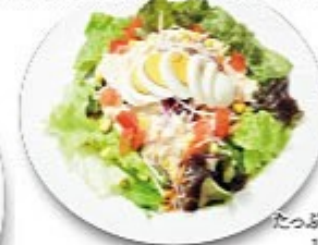
1日分の野菜 おはんふう菜園風スパゲッティ

当店人気上位の商品 たっぷり野菜をにんにく醤油ソースで! 1日分の野菜がしっかりとれる