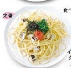
イカと明太子のクリームソーススパゲッティ 定番中の定番もみ海苔がアクセント