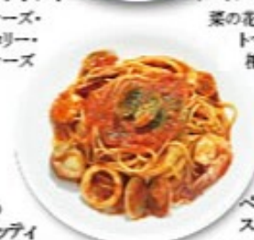
ペスカトーレスパゲッティ ペスカトーレイタリア語で「漁師」の意味