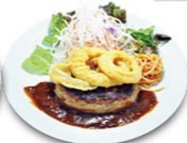
オニオンリングハンバーグ