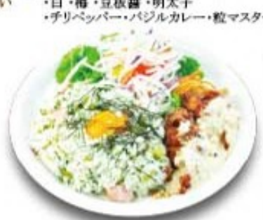
南蛮ワンプレートピラフ (おしんこピラフ・チキン南蛮)