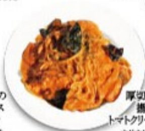
厚切りベーコンと揚げ茄子のトマトクリームスパゲッティ カリカリのベーコンと揚げ茄子の旨味がトマトクリームに絡む