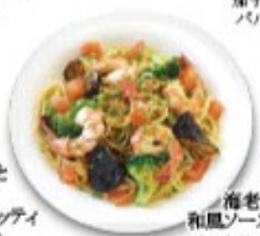
海老と茄子の和風ソーススパゲッティ ぷりぷり海老と揚げ茄子等野菜もしっかり和風スパ