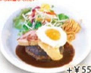
厚切りベーコンのふる玉チーズハンバーグ + ¥55