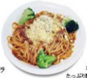
ボロネーゼ たっぷり野菜をじっくり煮込み新鮮な挽き肉を合わせた懐かし味