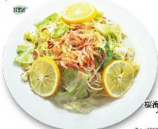
0...辛さ無し 11...通常 112...少し辛め 1113...辛め 桜海老と春キャベツのペペロンチーノ 桜エビの風味、キャベツの甘味と歯ごたえが最高です

セット内容:スープ・ミニサラダ・ケーキ・ドリンク(菜園風スパゲッティにミニサラダは付きません)