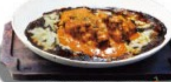
旨辛南蛮カレードリア