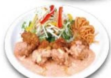
チキン明太子南蛮 明太マヨは何にでも合う!!