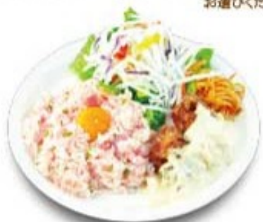
南蛮ワンプレートピラフ (梅ピラフ・チキン南蛮)

ハンバーグソースを お選びください 選べるハンバーグソース ・デミグラス・トマト・テリヤキ