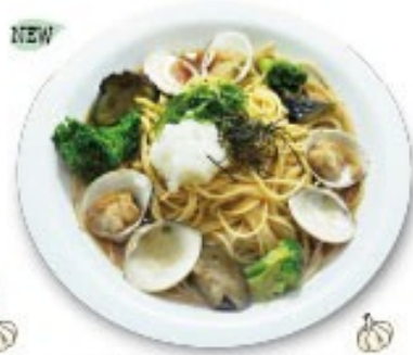
はまぐりと茄子と大根おろしの和風ソーススパゲッティ 潮、野、春を感じる食材を優しい和風ソースでお届け