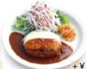
モッツアレラチーズハンバーグ + ¥55