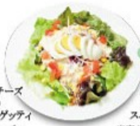
1日分の野菜 おしゃもじ 菜園風スパゲッティ 当店人気上位の商品 たっぷり野菜をいんにく独自のソースで1日分の野菜がしっかりとれる