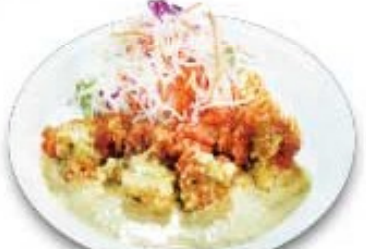
チキンバジルカレー南蛮 エスニック風味のあと引くほどよい辛さ