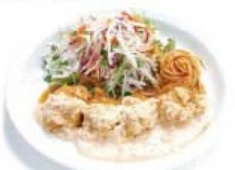
チキン豆板醤南蛮 甘口の南蛮酢にくぐらせ旨辛のタルタルをたっぷりコントラストが◎