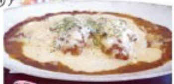
定番 チキン南蛮カレードリア