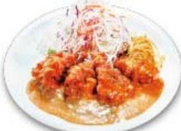
チキンチリペッパー南蛮 スパイスで食欲をそそります旨辛南蛮でもお試しください