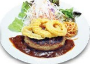
オニオンリングハンバーグ