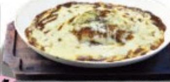
人気 デミグラスとチーズのハンバーグドリア