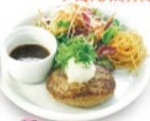
定番 つけて食べる和風ソースハンバーグ ソースの選択はできません