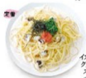
イカと明太子のクリームソーススパゲッティ 定番中の定番もみ海苔がアクセント