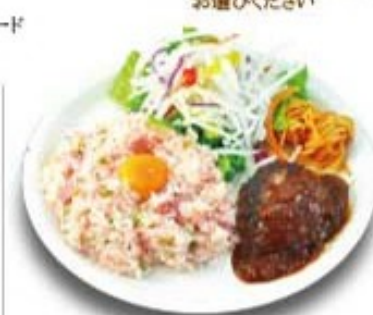
バーグワンプレートピラフ (梅ピラフ・ハンバーグ)