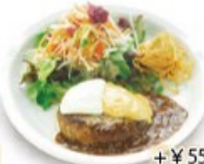
ダブルチーズハンバーグ + ¥55