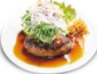
テリヤキハンバーグ ソースの選択はできません