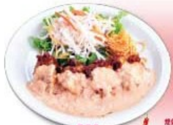
旨辛 W 南蛮 タルタルを2種類お選び下さい