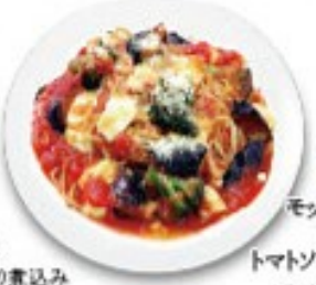
モッツアレラチーズと茄子のトマトソーススパゲッティ モッツアレラチーズ・茄子・ブロッコリー・パルメザンチーズ