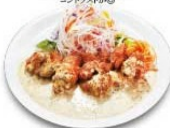
チキン粒マスタード南蛮 甘いタルタルにアクセント粒マスタードを使用しました