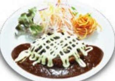
特製わさびマヨネーズソースのハンバーグ ソースをデミグラス、テリヤキからお選びください