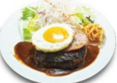
ハムエッグハンバーグ