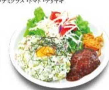
バーグワンプレートピラフ (おしんこピラフ・ハンバーグ)