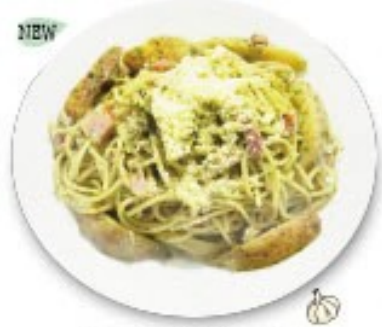
皮付きポテトとベーコンのジェノベーゼ 自家製のバジルペーストを使用 また食べなくなるパスタ