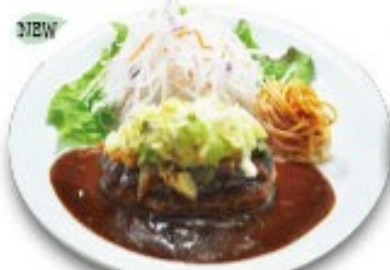
ザク盛り春キャベツとチーズのハンバーグ