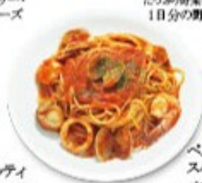
ペスタトーレスパゲッティ ペスタトーレイタリア語で「漁師」の意味