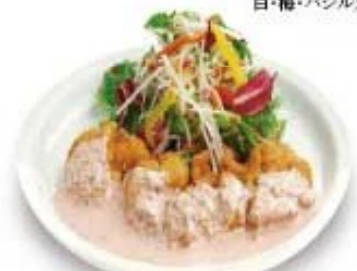
チキン梅南蛮 宮崎県美郷町産の完熟梅をタルタルにしました

送ったらこれ! 人気No.3 チキン4種南蛮 色々なタルタルが楽しめます 白・梅・バジルカレー・明太子・チリペッパー