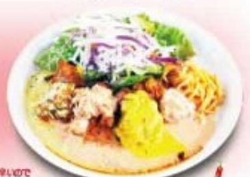
チキン旨辛4種南蛮 豆板醤・明太子・バジルカレー・チリペッパー