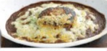
ハンバーグカレードリア