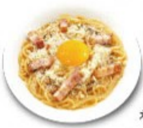
カルボナーラ あっさり食べやすくなりました