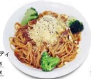
ボロネーゼ 単品 ¥1180(税込 ¥1288) ミニサラダ付 ¥1280(税込 ¥1408)