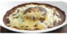
ハンバーグ カレードリア 単品 ¥1130(税込 ¥1243) ミニサラダ付 ¥1230(税込 ¥1353)