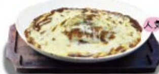
大塚店 デミグラスとチーズの ハンバーグドリア 単品 ¥1130(税込 ¥1243) ミニサラダ付 ¥1230(税込 ¥1353)