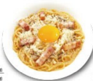
カルボナーラ 単品 ¥1280(税込 ¥1408) ミニサラダ付 ¥1380(税込 ¥1518)