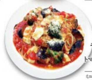
モッツアレラチーズ と茄子の トマトソーススパゲッティ 単品 ¥1180(税込 ¥1288) ミニサラダ付 ¥1280(税込 ¥1408)