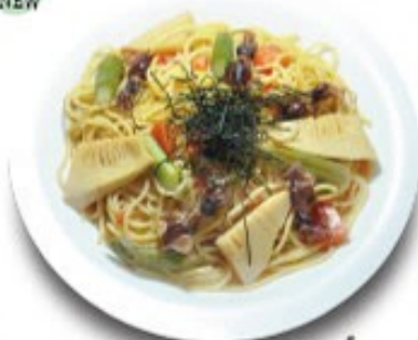
ホタルイカとアスパラと竹の子の 和風スパゲッティ 単品 ¥1180(税込 ¥1288) ミニサラダ付 ¥1280(税込 ¥1408)