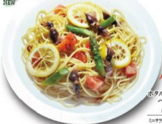
0...辛さ無し /1...通常 /2...少し辛い /3...辛い ホタルイカとアスパラの ペペロンチーノ 単品 ¥1180(税込 ¥1288) ミニサラダ付 ¥1280(税込 ¥1408)