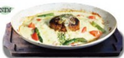
アスパラとハンバーグと クリームソースの和風ドリア 単品 ¥1180(税込 ¥1288) ミニサラダ付 ¥1280(税込 ¥1408)