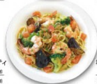
海老と茄子の 和風ソーススパゲッティ 単品 ¥1180(税込 ¥1288) ミニサラダ付 ¥1280(税込 ¥1408)