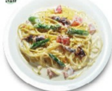
ホタルイカとアスパラの クリームソーススパゲッティ 単品 ¥1280(税込 ¥1408) ミニサラダ付 ¥1380(税込 ¥1518)