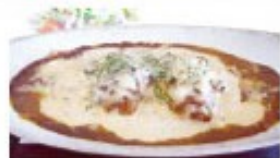
定番 チキン南蛮 カレードリア 単品 ¥1130(税込 ¥1243) ミニサラダ付 ¥1230(税込 ¥1353)