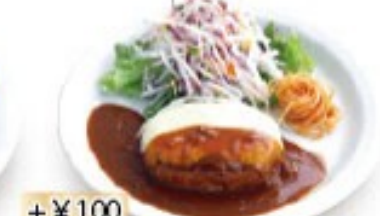
厚切りベーコンの ふる玉チーズハンバーグ