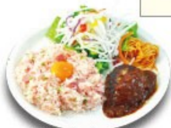
バーグワンプレートピラフ (梅ピラフ・ハンバーグ)