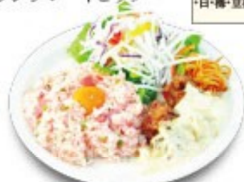
南蛮ワンプレートピラフ (梅ピラフ・チキン南蛮)