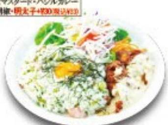
南蛮ワンプレートピラフ (おしんこピラフ・チキン南蛮)