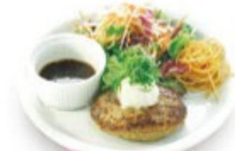
定番 つけて食べる 和風ソースハンバーグ ソースの量はできません