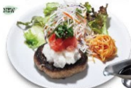
NEW 雪見トマトと大葉のハンバーグ 特製ボン酢ソース添え ソースの量はできません