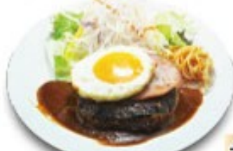
ハムエッグ ハンバーグ