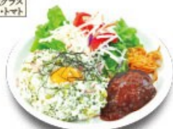
バーグワンプレートピラフ (おしんこピラフ・ハンバーグ)