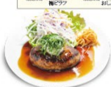
テリヤキ ハンバーグ ソースの量はできません