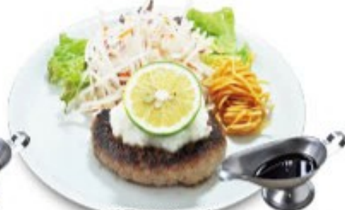
雪見ハンバーグ 特製ボン酢ソース添え ソースの量はできません