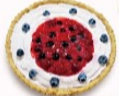
ベリー タルト 単品350円(税込385円)