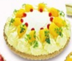
マンゴータルト ショートケーキ 単品350円(税込385円)