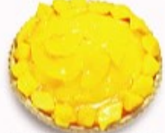
マンゴーとオレンジの タルト 単品350円(税込385円)