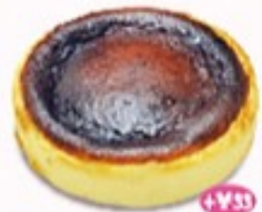
+¥35 バスク チーズケーキ 単品410円(税込451円)