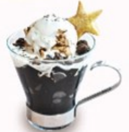
エラティナ デカフェ セット900円(税込990円) 単品600円(税込660円)