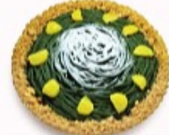
濃抹茶 モンブランタルト 単品350円(税込385円)