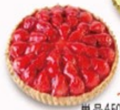
+¥110 苺のタルト ~5月15日まで 単品450円(税込495円)