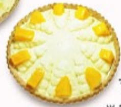
宮崎完熟 マンゴータルト 5月16日以降~ 単品350円(税込385円)