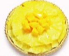
マンゴーとハニーグロウパイン のタルト 単品350円(税込385円)