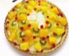
5月の フルーツタルト 単品350円(税込385円)