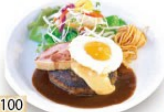
厚切りベーコンの ぶる玉チーズハンバーグ