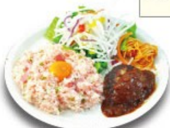
バーグワンプレートピラフ (梅ピラフ・ハンバーグ)