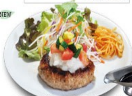
ズッキーニとトマトの雪見ハンバーグ 特製ポン酢ソース添え ソースの選択はできません