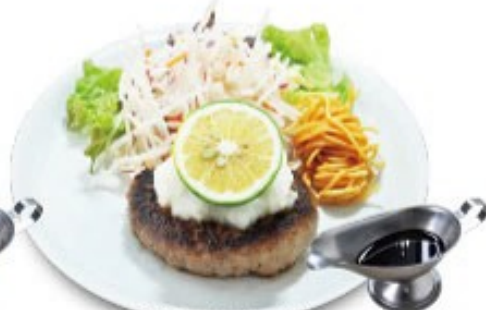
雪見ハンバーグ 特製ポン酢ソース添え ソースの選択はできません