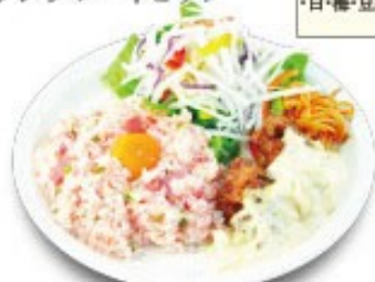
南蛮ワンプレートピラフ (梅ピラフ・チキン南蛮)