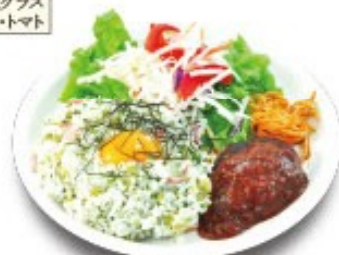
バーグワンプレートピラフ (おしんこピラフ・ハンバーグ)