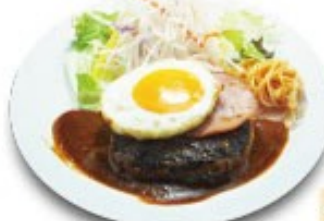
ハムエッグ ハンバーグ