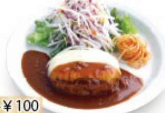
モッツァレラチーズ ハンバーグ