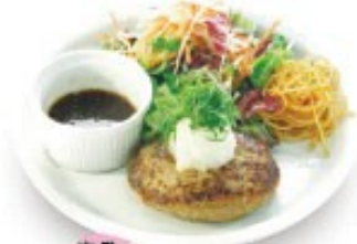
定番 つけて食べる 和風ソースハンバーグ ソースの選択はできません