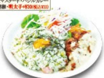
南蛮ワンプレートピラフ (おしんこピラフ・チキン南蛮)